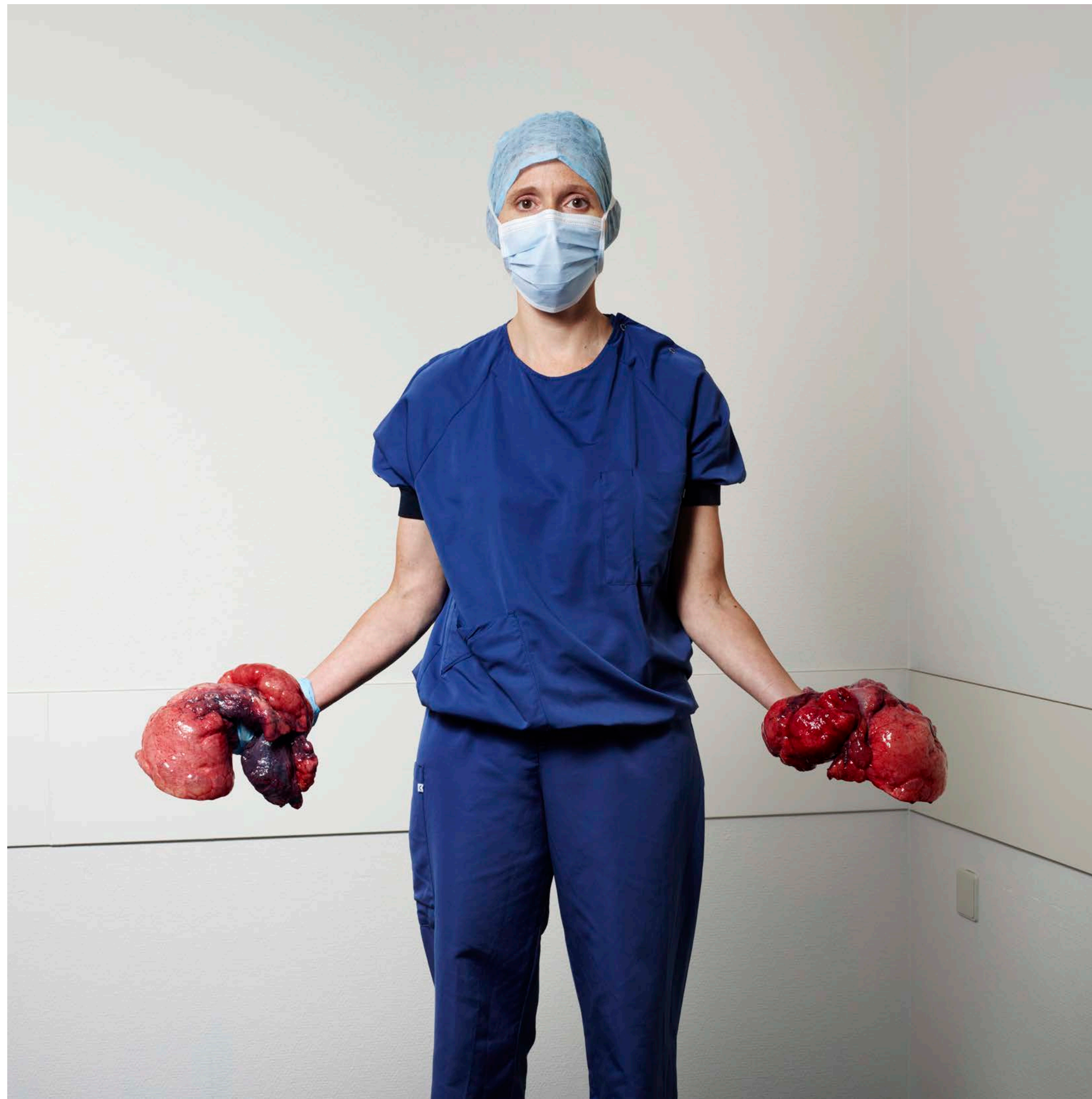
Self-Portrait 01 (2023)