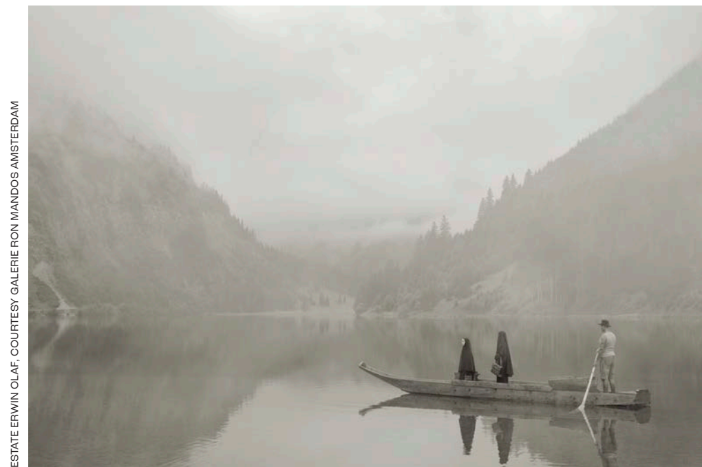
Im Wald Auf dem See (2020)